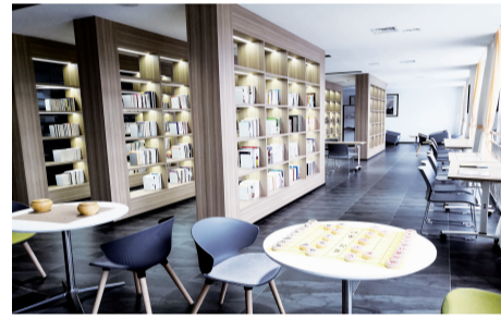
职工书屋丰富了公司职工的精神文化生活

家是避风的港湾，是心灵的归宿，对于职工来说，单位就是自己的第二个“家”。“职工利益无小事，踏实履职看细节”，19年间，伴随着全泰堂集团的飞速发展，全泰堂的“家”文化已经渗透到方方面面，“家”人之间相互支持、理解和信任，并彼此成就。