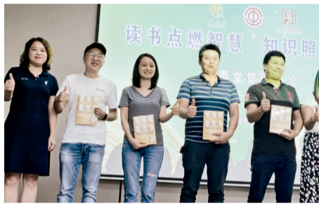
全泰堂公司工会组织青年员工开展读书分享会

锐意创新是企业经营与管理永久不变的思想。在全泰堂“植根于大健康产业，成为公众尊敬的企业。”发展目标的引领下，职工的创新理念和思路实现了飞跃发展。