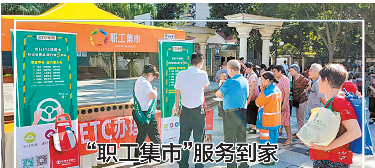
“职工集市”服务到家

据了解,“云端上的农庄”是成都市总工会大力实施消费扶贫,打造的工会普惠服务新品牌。依托“成都职工”工会普惠服务平台构建工会、政府、企业三方脱贫攻坚合作新模式,充分发挥工会、对口帮扶地政府、扶贫地政府、社会企业四方线上线下资源和渠道优势,产业化布局、市场化运营、常态化助力,大力提升贫困地区“自我造血”能力,帮助扶贫地建立核心产区农产品品牌,精准对接产业链,全力打通产品购销渠道,将甘孜、阿坝、凉山三州绿色、优质、生态的农特产品输送到千家万户,让职工群众切实感受到工会组织带来的便捷和实惠,助力当地脱贫攻坚。